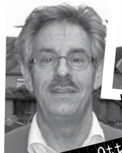
Ad den Otter